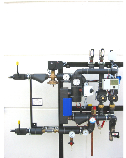
Typ: Tk/s - EnBW

1 Fernheizungsregler Typ 5575 Version MB, 2 Tauchtemperaturfühler Typ 5277, 1 Anlegetemperaturfühler Typ 5267, 1 Außenfühler Typ 5227 (Montage bauseits !), 1 Speicherfühler mit 250 mm CrNiMo-TH Typ 5277-5 (Montage bauseits !), 1 TR/STW.....komplett unter Einhaltung aller erforderlichen DIN –und VDE-Vorschriften verdrahtet und geprüft.